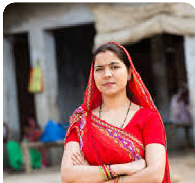
ग्राम सहायक/ सहायिका

मुख्य काम - योजना के बारे में गाओं की महिलाओं को अवगत करवाना,