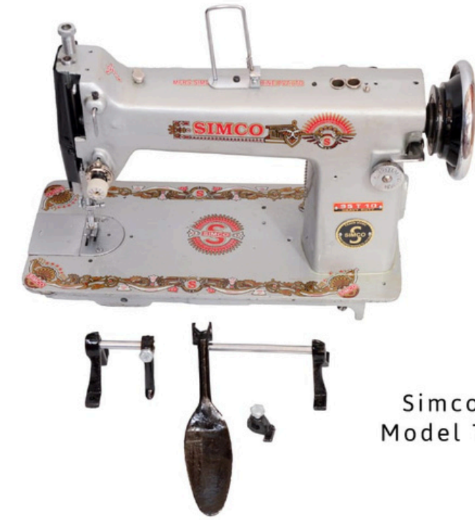
Simco Umbrella Model TA 2 95 T 10